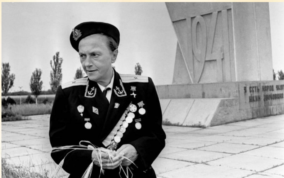
Людмила Павличенко в Одессе, 1971 год