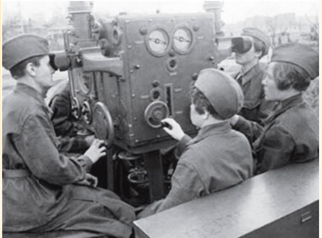
Зенитчики у прибора управления огнем

1077-й полк зенитной артиллерии войск ПВО состоял в основном из девушек-добровольцев (средний возраст – 18 лет).